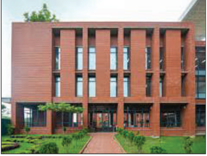
আগাখাঁ ইংলিশ মিডিয়াম স্কুল