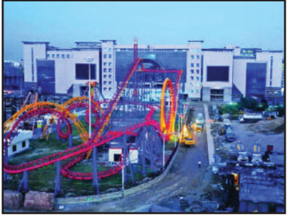
যমুনা ফিউচার পার্ক