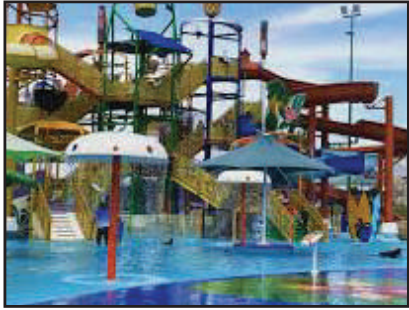
জলসিঁড়ি সেন্ট্রাল পার্ক