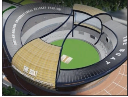
পূর্বাচল শেখ হাসিনা ক্রিকেট স্টেডিয়াম