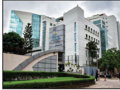
দেশের স্বনামধন্য এভারকেয়ার হসপিটাল